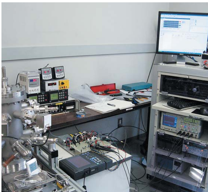
大阪府産業技術総合研究所内インキュベーション施設に構えたオフィス。新たな実験設備や計測機器が次々に導入され、研究開発体制を強化している

気体の流れや大気に含まれる物質などの計測機器を製造する岡野製作所。数ある製品のなかでも真空計測機器を得意としている。この技術にさらに磨きをかけようと、大阪府立産業総合技術研究所との共同研究に乗り出した。中小企業が単独では得にくい設備とネットワークを手にした同社は、従来品の10倍の性能を持つセンサ技術の可能性を見出した。